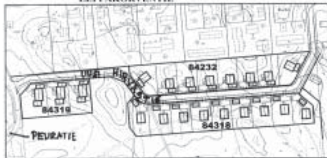
AO Erillispientalojen korttelialueet LEPPÄKORVENTIE

Suunnitteilla on Metsolansuon luode- pohjois- ja koillislaitaan uusia pientaloalueita. Peuratiestä erotetaan uusi Hirvatie, jonka varteen on suunnitteilla parikymmentä pientaloa.