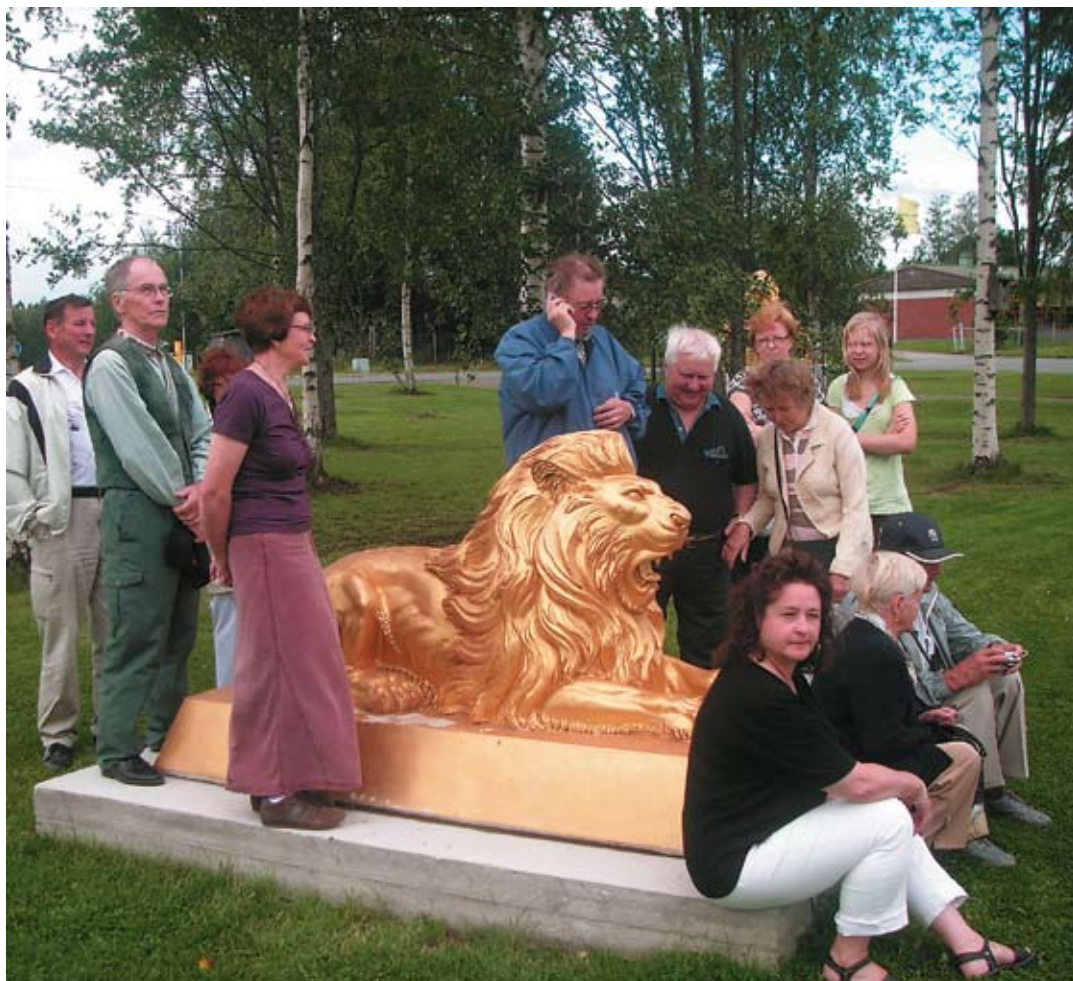
Korson omakotiyhdistyksen jäsemätka Hämeenlinnaan

Talot ovat enimmäkseen kaksikerroksisia omakotitaloja. Talojen takana on pitkulainen suojaosa piha, joka päättyy koskemattomaan luontoon. Tonttien koko on keskimäärin 1100 neliötä. Pihaille on istutettu mäntykankaaseen sopivia kasveja. Pihojen takaosa on jätetty siistittyyn luonnontilaan. Pihapiirin takana tonttien välissä on metsäistä luontoa polkuineen, kaikille yhteistä ulkoilualuetta. Pihaille on rakennettu lähes kaikissa taloissa mahtavat terassit. Pieniä uima-altaita on usean talon pihalla. Grillaus on tämän päivän muotiasia. Erilaisia grillikatoksia ja