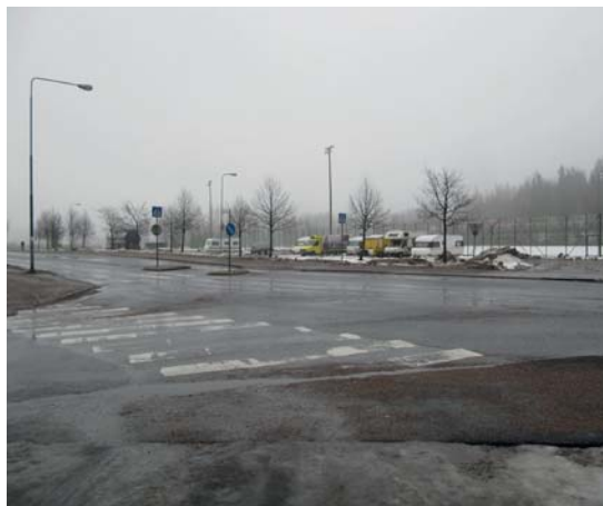
◀ ◀ Tavitie ankeimmillaan.