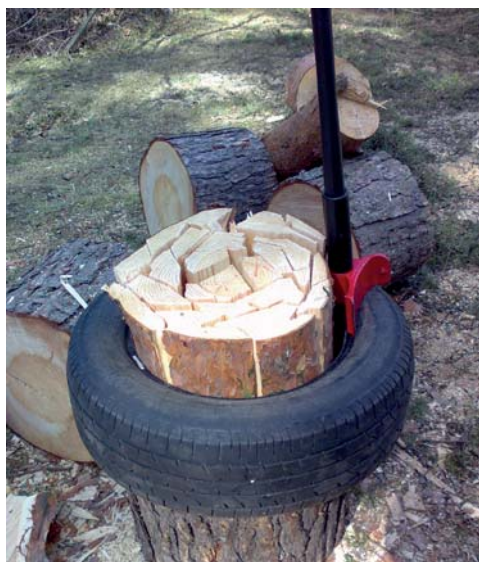
▲ Klapit kannattaa hakata renkaan sisällä Vipukirveellä tehtyjä klapeja ►