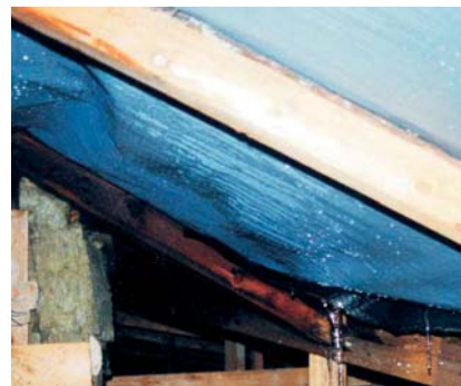
Aluskatteen "pussit" vuotavat. Vesi jäätyy ja sulaa pusseissa säävaihteluiden mukaan. Vesi valuu yläpohjan rakenteisiin. Aluskatteen asennustapa on puutteellinen. Aluskate on liian löysällä.