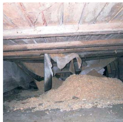
Tyypillinen vaurio alapohjan nurkasta, tuuletuskatveesta.